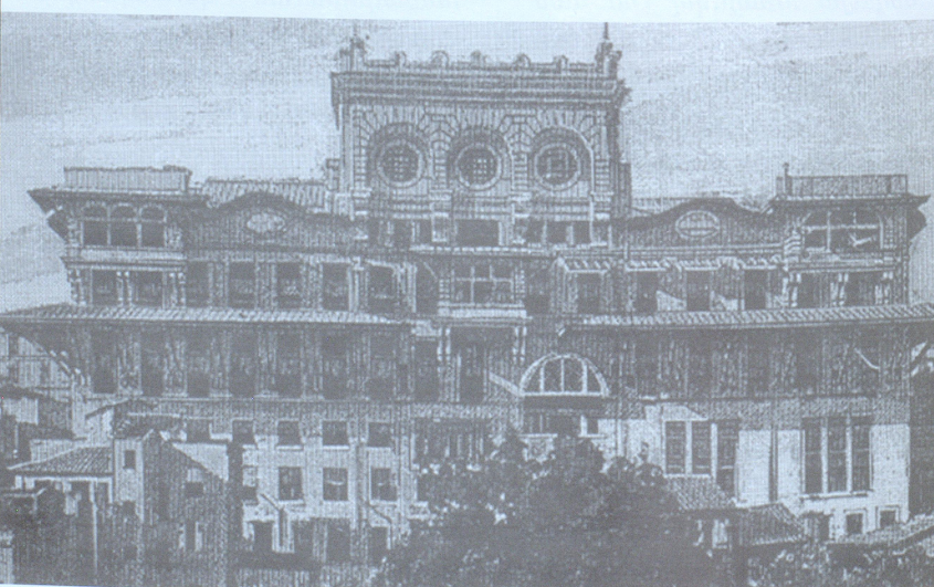
Բանկ Օսմանի շենքը

Որովհետև գրավել կայսրության գլխավոր բանկը՝ Բանկ Օսմանը: Այդ բանկի դաժանությունը կարող էր կաթվածահար անել Օսմանյան կայսրությունը: Բանկը գրավվեց 1896 թ., սակայն ռուսական դիվանագիտության ստառնալիսների