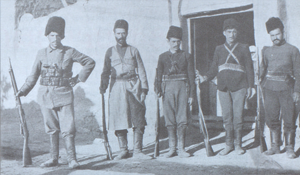
Դաշնակցական դասակազմումը Նախիջևանի Մազա գյուղում, 1905 թ.

Մոտենում էր մի իրադարձություն, որն իր կնիքն էր դնելու հայոց ողջ հեռագա դասնության վրա: Հայոց մեծ եղեռնը: Մեզանում հաճախ սխալ մեկնաբանության է արժանանում այնպիսի մի խնդիր, ինչպիսին 1915 թ. իրադարձություններն էին: Հարցը դիտարկվում է հետևյալ տեսանկյունից: Հայերը կազմակերպված չէին, դասարան չէին ինքնադաշնակության և դրա դասձանքով էլ կոտորվեցին, ըստ որում՝ ՀՅԴ-ն լիներով համահայկական ու հզոր կազմակերպություն, չկարողացավ իր դասնական դերը ճիշտ ձևով իրականացնել: Սակայն,